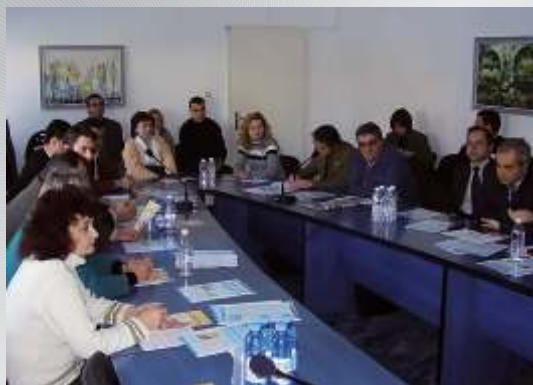
Дискусия в гр. Търговище на 20.12.2007г.

В град Търговище обсъждането премина при засилен интерес от страна на бизнеса, академичните среди, общинската и областна администрации.